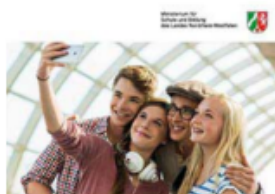
Die gymnasiale Oberstufe an Gymnasien und Gesamtschulen in Nordrhein-Westfalen Informationen für Schulleitende und Schüler, die im Jahr 2021 in der gymnasialen Oberstufe einsteigen.